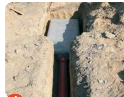
1 Kassetterna kan installeras parallellt eller i serie. Får staplas max. i 3 lager.