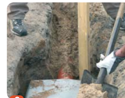
6 Magasinet packas in i geotextil och kringfylls med välgraderat friktionsmaterial i jämna lager runt hela magasinet.