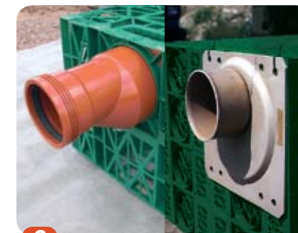
3 Anslutningsalternativ: Reduktion 160/110 mm. Släta rör dim 160 mm. Anslutningsplatta för dim. 200, 250 och 315 mm.