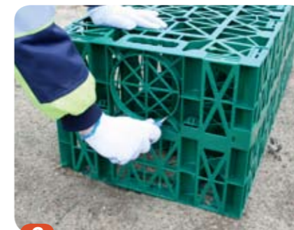
2 Anslutningshålet i dagvattenkassetten skärs fritt