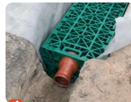
4 Kassetterna ska alltid installeras på den bredaste lednen (500x1000 mm). Kassetterna kan kryssmonteras (i förband). Clips och stapelpinnar ska användas.